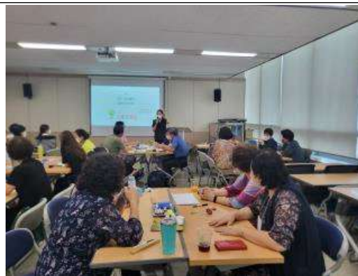
탄소중립 활동가 양성 교육