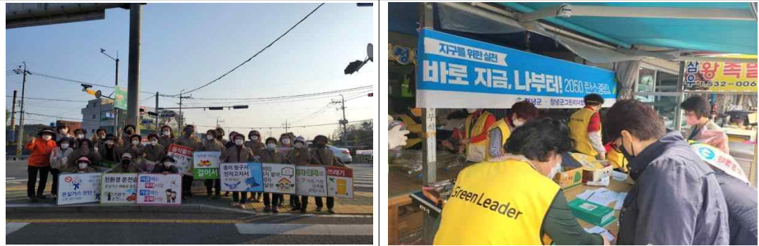
탄소중립 생활 실천 캠페인