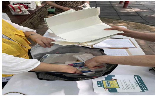
종이팩 분리배출 캠페인