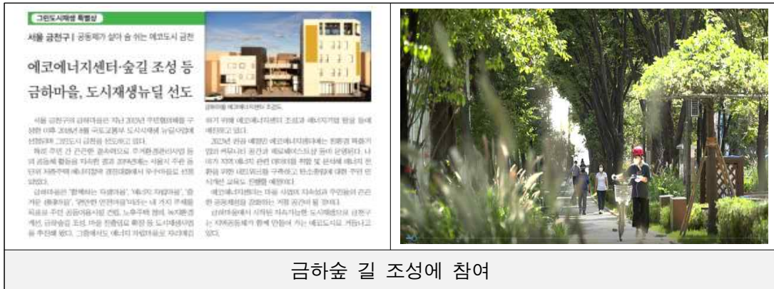
금하숲 길 조성에 참여