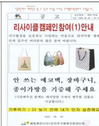
현수막모이기 경진대회 참가