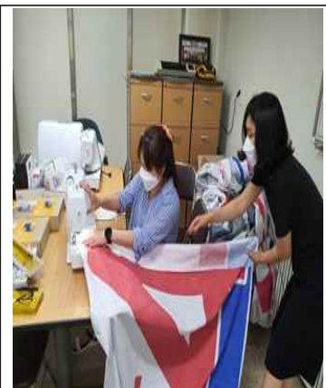
현수막 재활용 사업