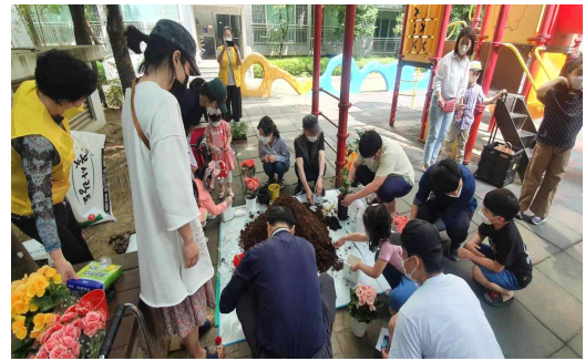
재활용 화분을 이용한 공기정화 식물 심시 행사 추진